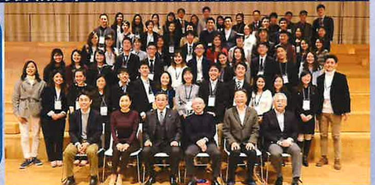
財団奨学生懇親会イベント（2019年開催）